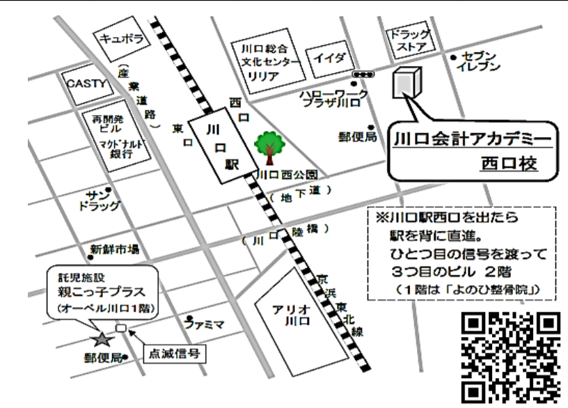
JR線 川口駅西口 徒歩4分